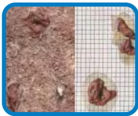
Deyecciones húmedas sobre la cama (izquierda) y sobre el papel (derecha)