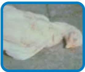
Aumento en la mortalidad