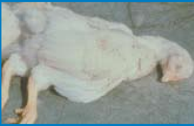
Aumento en la mortalidad