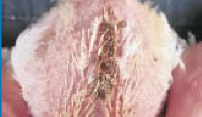
Diarrea y heces pegajosas